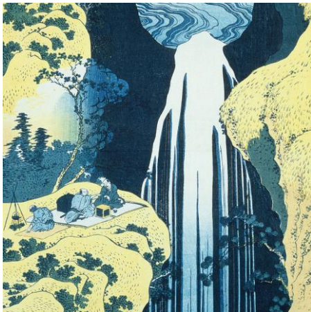
The Amida Waterfall in the Province of Kiso / Hokusai Katsushika

Motion Graphics : 千葉 博充 ( RIZING )