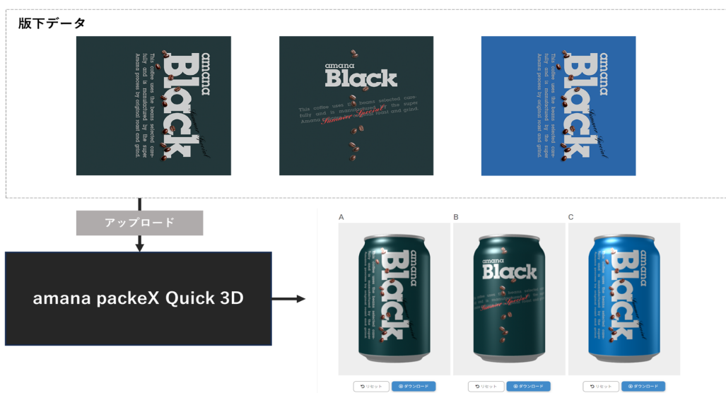
amana packeX Quick 3D の制作フローイメージ図

アマナは 3DCG による商品パッケージ画像を飲料、食品、ヘルスケアメーカーを中心に年間約 2400 点、制作しています。今後、「amana packeX（アマナパケックス）」を導入することにより、企業の課題解決や利便性を追求するとともに、お客様のコミュニケーション変革をクリエイティブで実現してまいります。