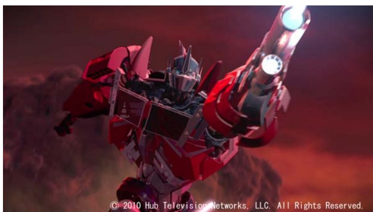
「トランスフォーマープライム シーズン1」より

PPIは、本セミナーの開催をはじめ、世界標準のクリエイティブ手法を学ぶ機会を継続的に提供することで、グローバル化する映像業界で活躍する日本のクリエイターの育成に繋がることを期待しています。今後も「誰もやっていないことを圧倒的なクオリティで世界に向けて発信していく」をミッションとして掲げ、映像業界の活性化に努めて参ります。