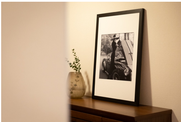
ARTSHOT (50cm×70cm) +FRAME ¥39,900～