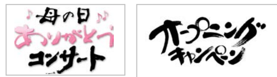
作風サンプルイメージ