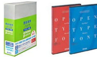
パッケージフォント商品イメージ