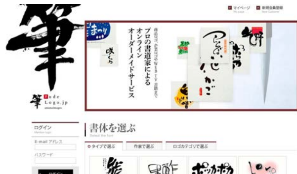
「fudelogo.jp」トップ画面イメージ