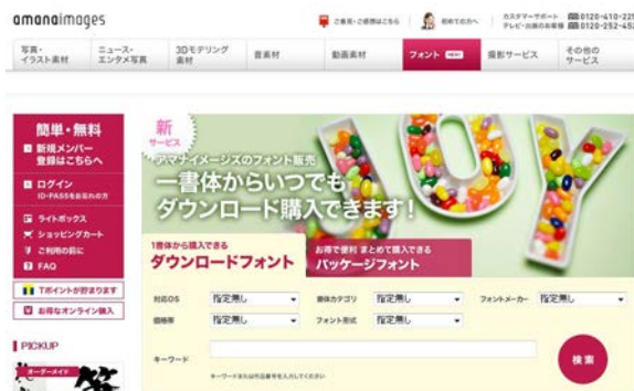
「amana.jp」フォントページトップ画面イメージ

アマナイメージズは、今回のフォントサービスを開始することにより、広告や出版のみならず、POPディスプレイや商品メニューなど、一般企業様や個人事業主様にも幅広くご利用いただきたいと考えています。また今後も、クリエイティブに携わる多くの方々にお役立ていただけるよう、「amanaimages.com」におけるコンテンツの拡充とサービスの開発を続けてまいります。