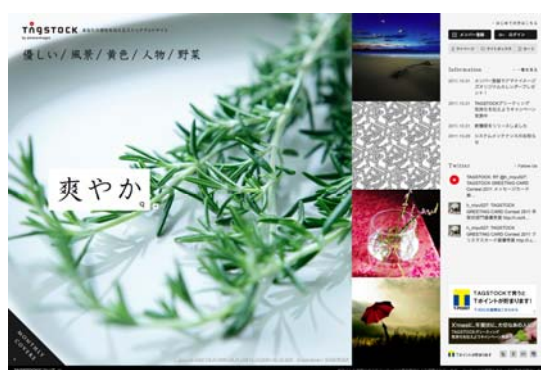
「TAGSTOCK」サイト TOP 画面イメージ

写真・イラスト作品を「TAGSTOCK」に投稿するクリエイターは、自身の作品の中から、購買者に無料で提供する「フリー作品」の設定が可能になりました。提供する期間もクリエイターが自由に決められるので、他の作品をアピールするプロモーションとしても活用できます。また、購買者にとってはブログなどの個人的な用途に、クオリティの高い画像を無料でご利用いただけます。