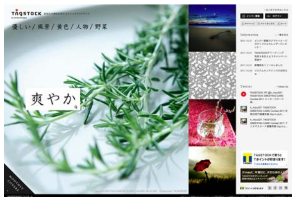
「TAGSTOCK」サイトTOP画面イメージ

「TAGSTOCK」は、写真愛好家やイラストレーターなどのクリエイターが、自ら撮影・制作した写真やイラストを投稿して販売することができる、写真・イラスト素材の販売サイトです。素材は1点あたり500円から購入でき、Webサイトやグリーティングカードなど、様々な用途のビジュアル素材として使用いただけます。素材を購入する前に、専用ページにてTAGSTOCKメンバーIDとT-ID(TログインID)を連携していただくと、「TAGSTOCK」での購入金額100円(税込)につきTポイントが1ポイント貯まります。貯まったTポイントは、TSUTAYAやファミリーマート、カメラのキタムラ、ガスト、Yahoo!ショッピングなどTポイントアライアンス企業78社約38,000店舗の店頭やサービスでご利用いただけます。