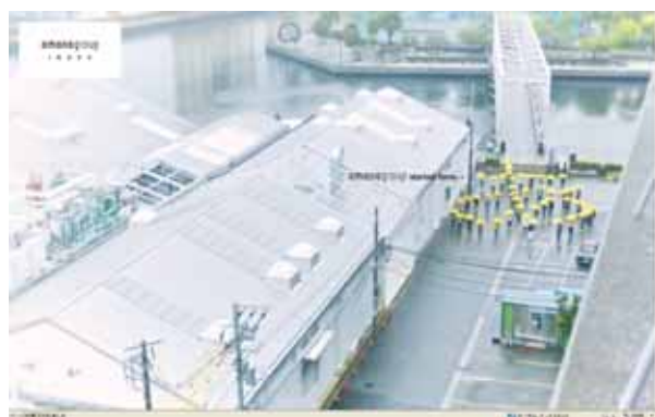
amanagroup INDEX 画面イメージ