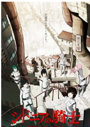
(c) 式瓶勉・講談社 / 東亜重工動画制作局

アマナグループにおいてエンタテインメント映像事業を手がける株式会社ポリゴン・ピクチュアズ(本社:東京都港区、代表取締役社長:塩田周三)は、現在製作中のアニメ『シドニアの騎士』(原作:式瓶勉著、講談社刊)において、メインキャスト、音楽制作スタッフが決定したことをお知らせいたします。なお、本作は2014年春からテレビ放送開始が決定しております。(放送内容詳細は後日お知らせいたします)