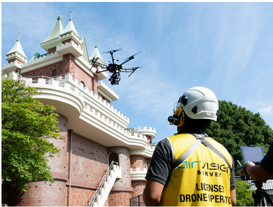
キャノン製 EOS 5Ds R にカメラ遠隔制御システムを搭載した DJI MATRICE 600 PRO を操縦する airvision survey パイロット。

このたび、施設のインフラ点検へのドローン活用実現化を目指す姫路市と、姫路市の持つ公共施設の壁面（ルーフ含む）調査の実証実験を、株式会社環境総合テクノス、ケイプラス株式会社、株式会社 GEO ソリューションズの協力を得て実施いたしました。