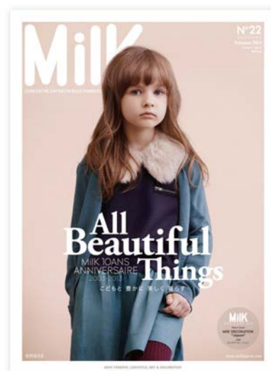
ミルクジャポン No22 (Autumn 2013)

最新号『ミルクジャポン』No22 は、本国フランスの Miik10 周年を記念したスペシャルイシューです。ミルクジャポンがセレクトしたキッズファッション 10 ブランド、10 スタイリングを撮り下ろした秋冬ファッション特集を皮切りに、子どもたちとその家族の特別な秋を演出する構成です。またヨーロッパで人気のインテリア版 Miik「別冊ミルクデコレーション」が日本初登場します。