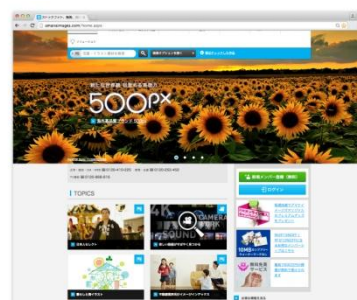
トップ画面イメージ