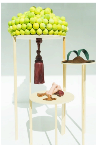
© Harumi Shimizu Open Fruit is God, 2014