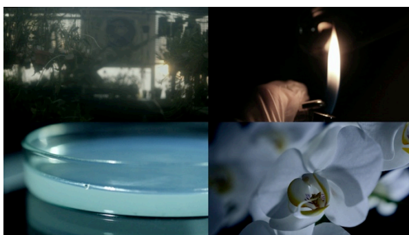
© Kanako Azuma Eternal lovers, 2016