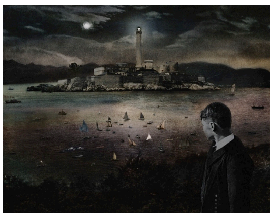
© Hideyuki Ishibashi Passages Obscurs, 2015, courtesy of IMA gallery