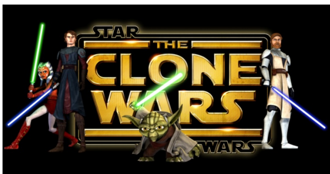
Star Wars: The Clone Wars © Lucasfilm Ltd. All rights reserved.