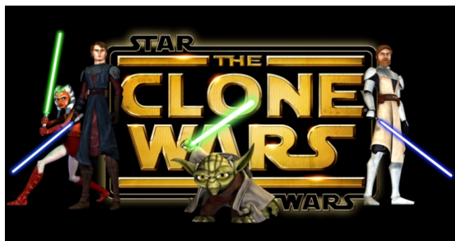
Star Wars: The Clone Wars