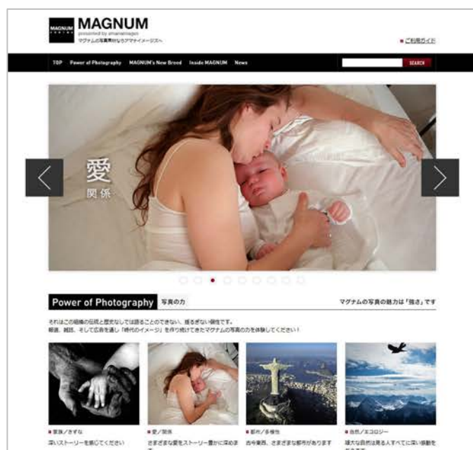
スペシャルサイト TOP 画面

アマナグループにおいてストックフォト販売事業を手がける株式会社アマナイメーヅ(所在地:東京都品川区、代表取締役社長:小羽真司、以下アマナイメーヅ)は、2012年11月15日(木)、広告制作に携わるクリエイター向けに、スペシャルサイト『MAGNUM presented by amanaimages』をオープンいたしました。(URL: http://amanaimages.com/magnum/ )